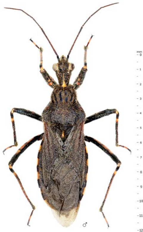
Abb. 5: Erstmals konnte die Raubwanze Coranus aethiops in Österreich festgestellt werden.