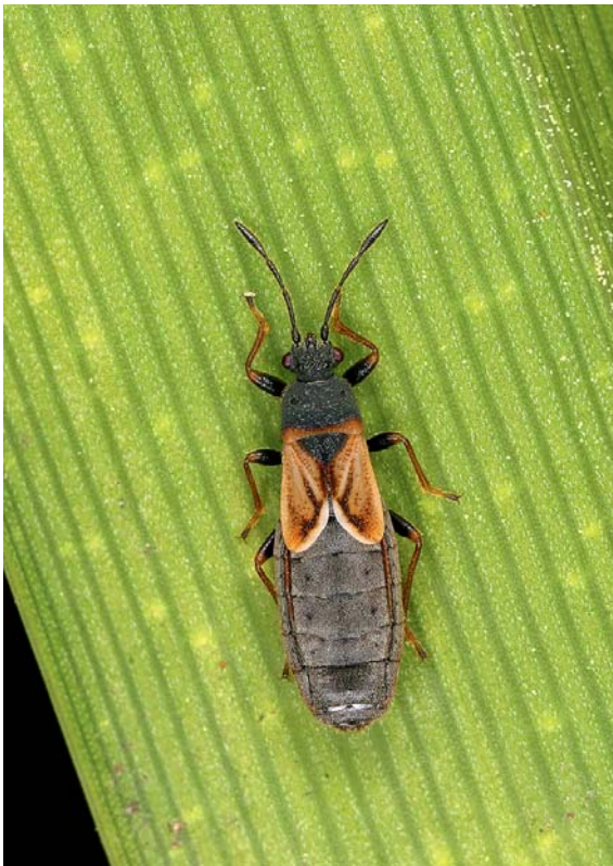
Abb. 6: Die an Poaceen feucht-nasser und trockener, störungsarmer Standorte lebende Bodenwanze Ischnodemus sabuleti wird erstmals für Oberösterreich gemeldet.