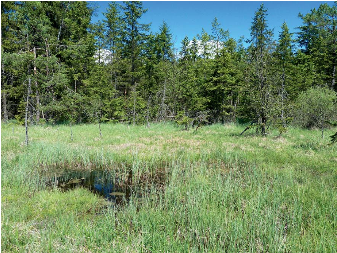
Abb. 2: Die an Poaceen feucht nasser und trockener, störungsarmer Standorte lebende Bodenwanze Ischnodemus sabuleti wird erstmals für Oberösterreich gemeldet. Probestfläche im Moor am Iglbach (IG-M).