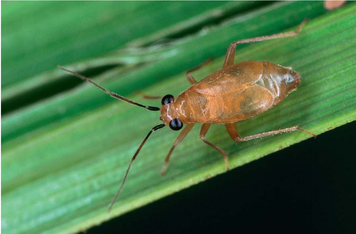
Abb. 4: Fieberocapsus flaveolus erreicht in den Böhmerwaldmooren die Südgrenze ihrer bekannten Verbreitung.

In Bayern und in Deutschland ist die Art vom Aussterben bedroht (ACHTZIGER et al. 2003, GÜNTHER et al. 1998). Erstfund für Österreich.