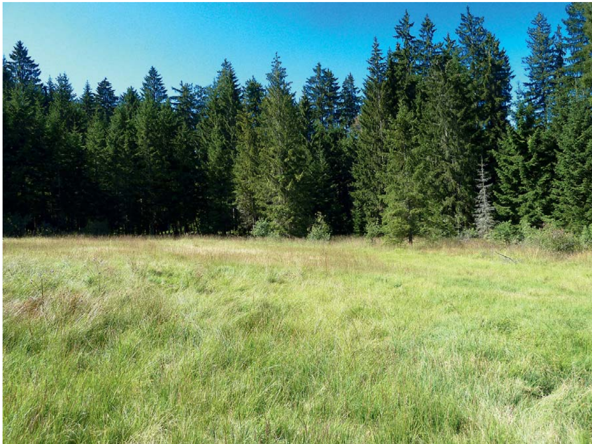
Abb. 3: Die an Poaceen feucht nasser und trockener, störungsarmer Standorte lebende Bodenwanze Ichnodemus sabuleti wird erstmals für Oberösterreich gemeldet. Probeflächen in der Semmelau: im Vordergrund die einmähdige Probefläche SE-F (Pfeifengraswiese) mit Blick auf die ungenutzte Fläche SE-M (degradierter Hochmoorrest) im Hintergrund.